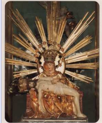
Sedembolestná Panna Mária patročka Slovenska