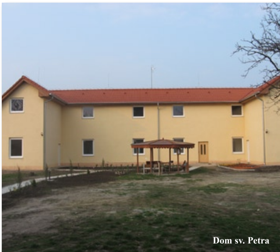
Dom sv. Petra

Centrum Fidúcia slúži pre mužov v núdzi. Nachádzajú sa tu tri objekty. Dva objekty sú vo vlastníctve Spolku sv. Vincenta a tretí objekt je v dlhodobom prenájme od mesta Šurany. Na dom sv. Pavla bol vypracovaný projekt, ktorý bol podporený z Ministerstva práce, sociálnych vecí a rodiny SR a to sumou 26 600 €. 10% prispel Spolok ako spolufinancovanie a to sumou 2 956 €. Urobila sa nová strecha, plastové okná, vchodové dvere a izolácia celého domu. Registrácia zariadenia je na 21 klientov.